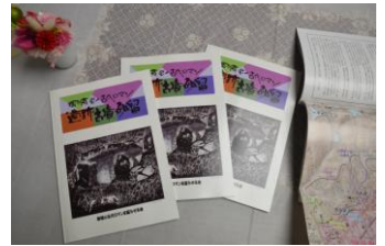
御野小へ冊子寄贈70部