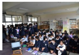
御野小6年生と 「堂々川」を学ぶ