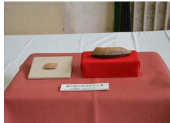
御領遺跡出土土器片