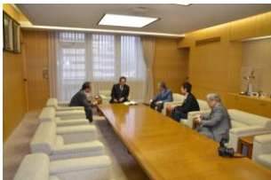
冊子完成PR 羽田市長を訪問