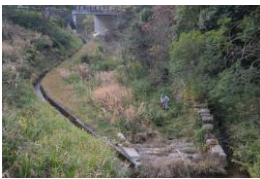
定例会迫山砂留下