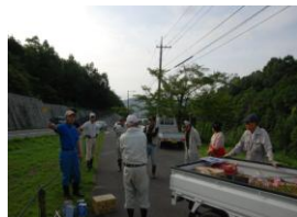
最近では最高の参加者 予定以上の成果