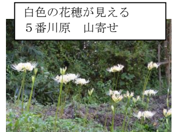
白色の花穂が見える 5番川原 山寄せ