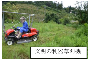
文明の利器草刈機