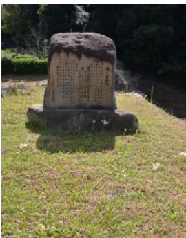
源氏=白 平家=赤 村塚石が教 える歴史ロマンを花色で知る