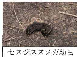
セスジスズメガ幼虫