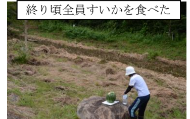
終り頃全員すいかを食べた