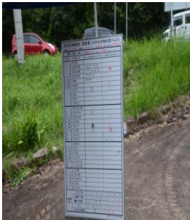
成果発表 綺麗な水1カ所 やや綺麗な水2ヶ所確認出来た