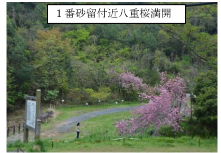
1番砂留付近八重桜満開