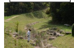
ホタルを飛ばす為川の中の草刈作業

*ホタルや花の堂々川情報はホタル同好会の推奨ブログ“自然を尋ねる人”に随時詳しく載せています。