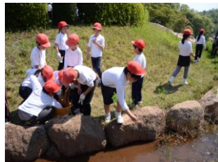
湯田小のカワナガ放流