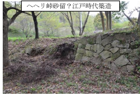
へり峠砂留？江戸時代築造