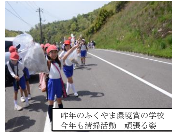
中条小はゴミを拾いながら到着