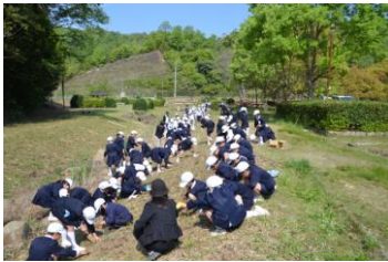
手際良く御野小の彼岸花植栽