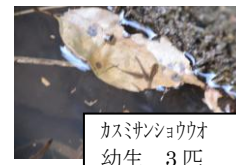
カスミシヨウオ 幼生 3匹