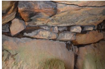
鳴る岩古墳イメージ