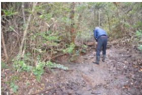
カスミの住める環境