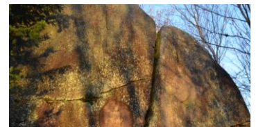
冬至の日割れ目から朝日が昇る