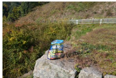
1番、6番砂留整備除草剤散布