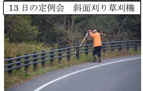
13日の定例会 斜面刈り草刈機