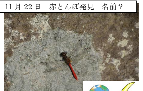
11月22日 赤とんぼ発見 名前？