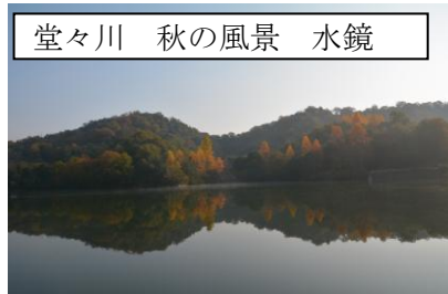
堂々川 秋の風景 水鏡