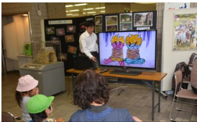
倭武尊に捉えられたゴンとハチのDVD