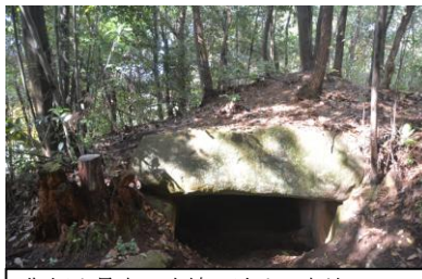
御領山最大の古墳 迫山・大坊クラス