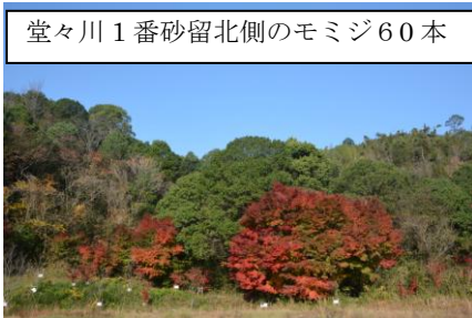
堂々川1番砂留北側のモミジ60本