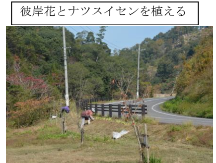
彼岸花とナツスイセンを植える