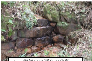
5. 御領山の瀬名田砂留