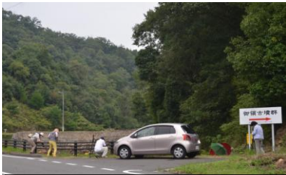
2.早くも5番砂留下方で写真撮影5人