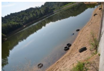
6. 10本近くを捨てている