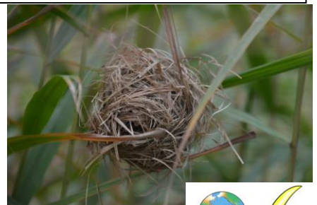
7. 準絶滅危惧種 かやネズミの巣発見