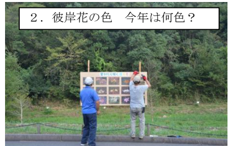
2. 彼岸花の色 今年は何色？