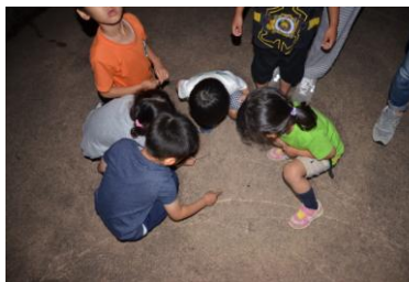
遊歩道に来る平家ボタル