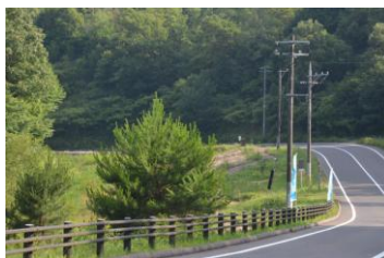
6月18日ホタルの幟撤去