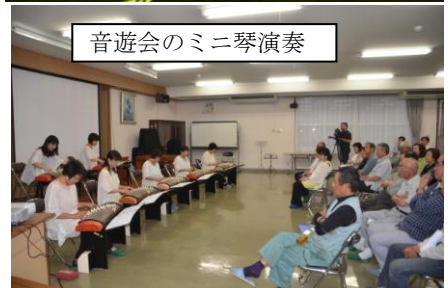
音遊会のミニ琴演奏