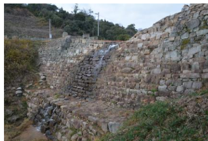
6 番砂留を東から見る