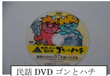
民話 DVD ゴンとハチ