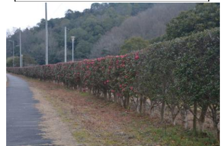
堂々公園のサザンカ並木花満開