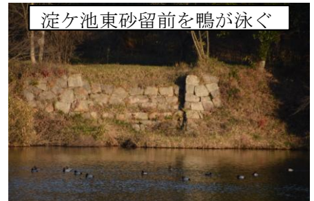
淀ヶ池東砂留前を鴨が泳ぐ