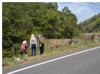
この場の水仙を引取る人