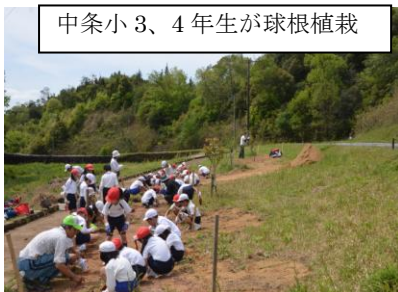
中条小 3、4 年生が球根植栽