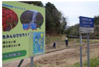
同じ場所へ乗用車が突っ込む 桜にぶつかりさらに下の石迄