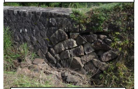
崩落が始まった5番砂留