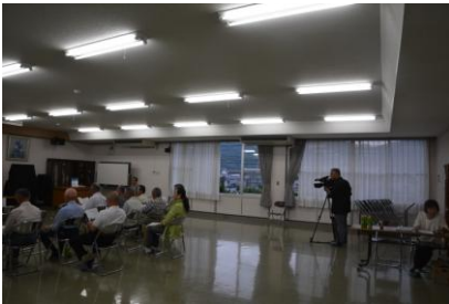
同好会第11回通常総会