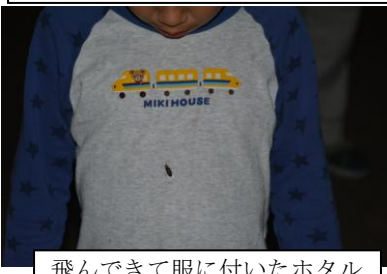
飛んできて服に付いたホタル