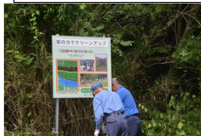
見えぬと苦情の看板3番東へ移動