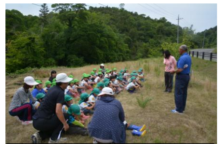
副会長の挨拶と球根の植え方指導