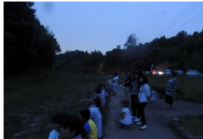
5番川原遊歩道の見学者