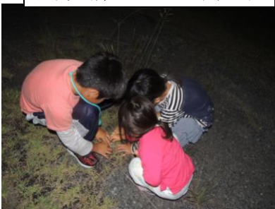
ホタルと遊べるのは堂々川だけ