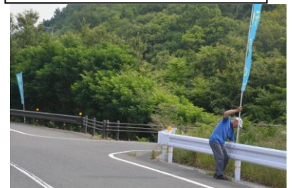
神辺町観光協会共催 幟を撤去